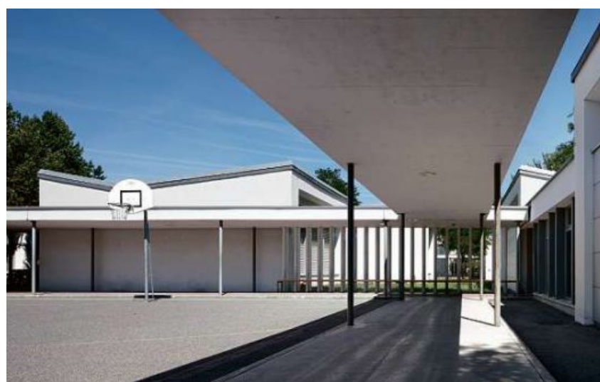
Eine familiäre Atmosphäre: Die einzelnen Pavillons des Schulhauses Herold in Chur sind mit gedeckten Laubgängen verbunden.

Die schlichten, mit Ausnahme der Turnhalle streng nach Südosten orientierten Gebäude sind in lockerer Anordnung in ein geometrisches Raster eingeschrieben und mittels offener, gedeckter Verbindungsgänge zu einem räumlich abwechslungsreichen Gesamtkomplex mit grosszügigen Pausenhöfen zusammengefügt. Asymmetrische Schmetterlingsdächer geben den Häuschen das Gepräge von Zelten. Die grossflächigen Verglasungen, die hofbildenden Lamellenwände und die zierlichen Stahlstützen der Laubgänge tragen mit zur luftig-leichten Wirkung der Architektur bei, die ihrerseits den Anspruch an eine repressionsfreie Pädagogik unterstreicht.